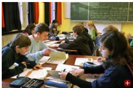
Unterricht an einem Gymnasium in Bremen: Keine Zeit für Experimente?