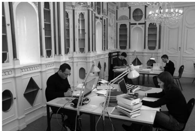
Lesesaal der Uni Hohenheim

Allerdings gibt es nicht an jeder Universität die vollständige Fächerpalette. Die Universitäten bilden Schwerpunkte und entwickeln zunehmend ein eigenständiges Profil, das durch gegenseitige Kooperationen erweitert wird. Die ältesten baden-württembergischen Universitäten Heidelberg (gegründet 1386), heute Exzellenzuniversität, Freiburg (gegründet 1457), heute Exzellenzuniversität, und Tübingen (gegründet 1477) bieten nach wie vor ein außerordentlich breites Fächerspektrum, das Geisteswissenschaften und Medizin einschließt. An den Universitäten Karlsruhe (Exzellenzuniversität) und Stuttgart spielen vor allem die Ingenieur- und Naturwissenschaften eine zentrale Rolle. Kleinere und neuere Universitäten haben sich häufig auf bestimmte Fachrichtungen spezialisiert: Wer sich für eine wirtschafts- und sozialwissenschaftliche Ausbildung interessiert, sollte sich die Universität Mannheim anschauen. Oder auch die Universität Hohenheim, die ihre Schwerpunkte neben den Wirtschaftswissenschaften in den Bereichen Agrarwissenschaften und Lebenswissenschaften hat. Die Universitäten Konstanz (Exzellenzuniversität) und Ulm sind die beiden jüngsten Universitäten in Baden-Württemberg. In Konstanz kann man aus natur-, geistes- und sozialwissenschaftlichen Angeboten auswählen. An der Universität Ulm, 1967 gegründet, stehen heute natur-, ingenieurwissenschaftliche und medizinische Fächer im Mittelpunkt.