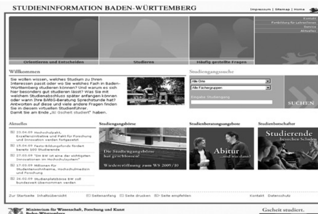
Studieninfos im Netz

Vor dem Hintergrund einer frühzeitigeren – und vermutlich auch intensiveren – Auseinandersetzung mit den anstehenden Entscheidungen weisen Schülerinnen den nutzbaren Informationsquellen generell eine größere Wichtigkeit zu als Schüler. In Übereinstimmung damit ist ihnen sowohl die Broschüre „Studieren in Baden-Württemberg“ als auch die Website www.studieninfo-bw.de bekannter bzw. vertrauter als Schülern (Broschüre: 72,3 vs. 58,6 Prozent 5 ; Website: 63,7 vs. 46,7 Prozent). Im Kontrast zu ihrem ausgedehnten Informationsverhaltensverhalten geben die befragten Schülerinnen jedoch an, dass ihre Entscheidungen weniger fundiert seien (2,5 vs. 2,3). Entsprechend fühlen sie sich auch durch die Schule weniger gut vorbereitet als Schüler (2,8 vs. 2,6). Nach allem gehen Schülerinnen zwar die Entscheidungen bezüglich ihrer weiteren Ausbildung frühzeitiger und ernsthafter an als ihre männlichen Mitschüler, aber ungeachtet