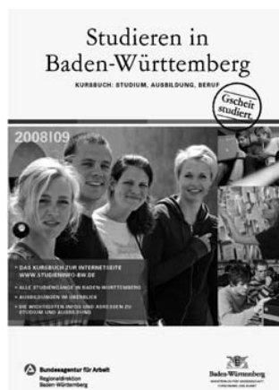
Das Infomaterial kommt gut an

Auch nach der Schulzeit besteht ein fortwährender Bedarf an geeigneten Informationsmedien und Entscheidungsunterstützungssystemen, da immerhin 70,7 Prozent der Schüler eine „Auszeit“ (von durchschnittlich 9,2 Monaten Dauer) zwischen Schule und Hochschule nehmen wollen 4 . Es ist zu vermuten, dass ein Teil der Schüler auch während dieser Phase Überlegungen zur Berufs- und Studienwahl anstellen wird und sich entsprechend informieren möchte.